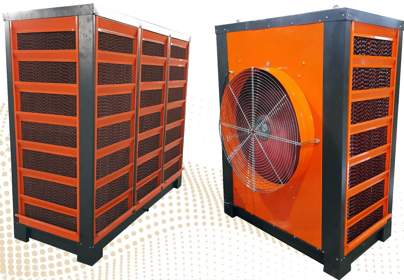
PFT - AHU - 1200

کولر صنعتی: کولر های صنعتی آکسیال تولید شد در شرکت پارسا فن تهویه جهت خنک سازی محیطی طراحی و تولید شده اند زیرا در سالن های بزرگ صنعتی اگر بخواهیم از یک سیستم کولر مرکزی استفاده کنیم نیاز به کانال کشی طولانی است و همچنین فضای قابل توجهی از محیط کار را نیز اشغال میکند. نکته دیگر در این زمینه اینکه استفاده از سیستم های مرکزی در صورت خرابی کل واحد صنعتی دچار مشکل خواهد شد.